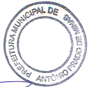
Welison Sina da Fonseca Prefeito Municipal