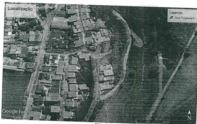
IMAGEM 1.0